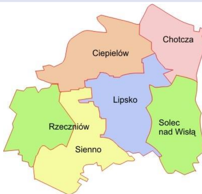
Rysunek 2. Położenie miasta i gminy Lipsko na terenie powiatu lipskiego.