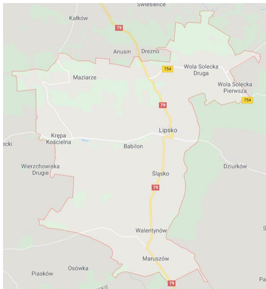
Rysunek 1. Granice miasta i gminy Lipsko.

Granice administracyjne miasta i gminy przedstawiono na poniższym rysunku.